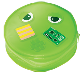
初回限定版に付属の オリジナルウォーターインCDケース

※本製品は、VOCALOIDソフトウェア本体と歌声ライブラリ「ガチャッポイド」で構成されています。